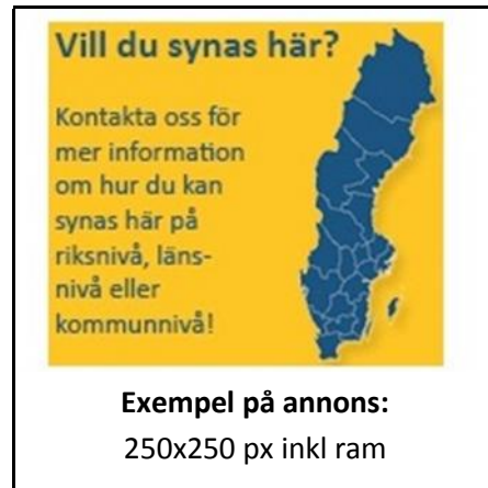
Annons med "luft" runt bild och text. En ram runt annonsen.