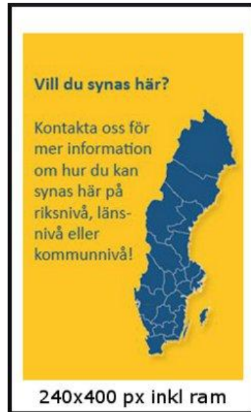
Annons med "luft" runt bild och text. En ram runt annonsen.