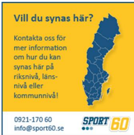
Annons med utfallande bild. Ingen ram runt annonsen behövs.