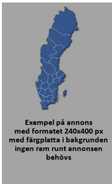
Annons med färgplatta i bakgrunden. Ingen ram runt annonsen behövs.