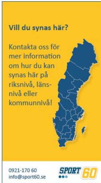
Annons med utfallande bild. Ingen ram runt annonsen behövs.